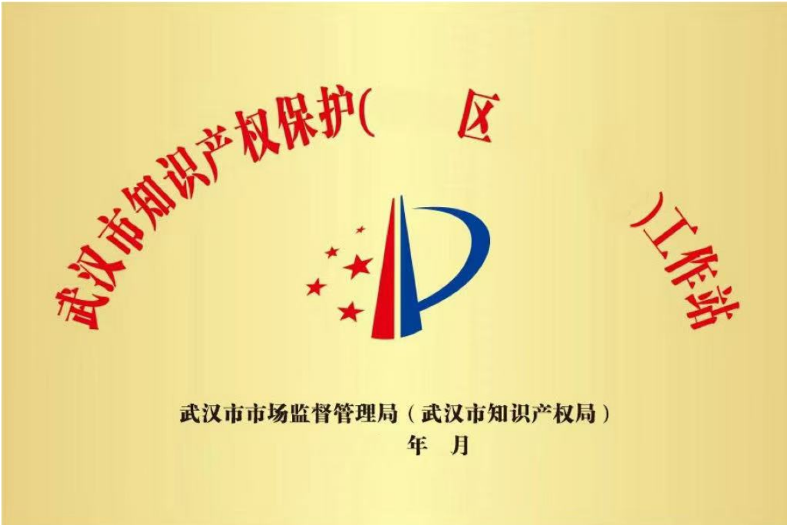
图A. 1 武汉市知识产权保护工作站标识标牌

武汉市知识产权保护工作站标识标牌见图A. 1，规格60cm*40cm，材质为弧面钛金。